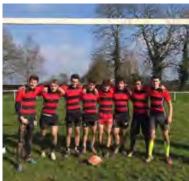
↑ Des précautions sont à prendre au rugby.

T u fais du rugby ? Tu as déjà vu un match de rugby ? Tu sais que ça peut faire mal ? Tu ne veux pas de bobos ? Alors suis bien les conseils du Label. Avec plus de 306 000 licenciés en France en 2017, le rugby est devenu un sport très attractif du fait des valeurs et de l'esprit qu'il transmet, mais aussi par son caractère atypique dû à l'ovalité du ballon. Cependant, malgré les mesures de sécurité prises depuis la création de ce sport (placage sous le buste, plus le droit d'arriver élaner lors des mêlées), il y a toujours de nombreux accidents, allant de la simple fracture à des accidents plus graves ! L'entité World Rugby a donc établi "5 piliers clés", à commencer par un forum de révision du droit qui s'est tenu à Paris en mars, et qui met l'accent sur la charge d'entraînement, la surveillance des traumatismes, la