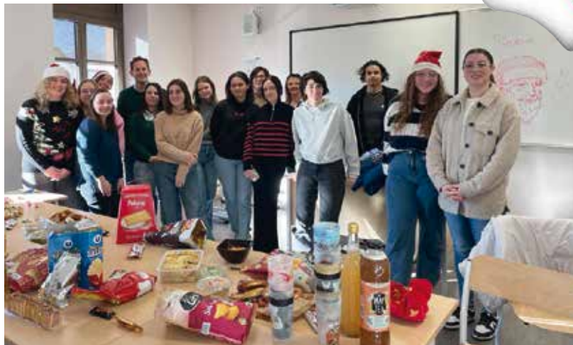
Un moment sympa pour les BTS 1 et les BTS 2 avec certains de leurs professeurs présents ce jour-là.

Le concept est simple, tirer au sort parmi les étudiants et les professeurs de la classe afin de s'offrir un cadeau d'une valeur comprise entre cinq et dix euros. Tout était bien évidemment secret, c'est seulement le jour J que nous avons découvert qui était notre P(M)ère Noël mystère. La remise des cadeaux a eu lieu le mardi 19 décembre 2023 lors d'un repas au cours duquel chacun a amené de quoi se restaurer. Ce fut un moment très convivial que nous allons reconduire l'année prochaine! Apparemment, nous avons lancé la mode au lycée, les élèves, et même les profs, nous ont imités!