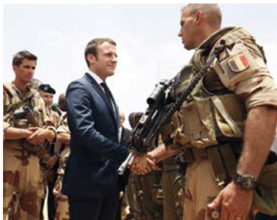
Emmanuel Macron, chef des Armées rend visite aux forces militaires.

LE SERVICE MILITAIRE POURRAIT REVENIR ! « SAVIEZ-VOUS QUE 70 % DES FRANÇAIS SONT FAVORABLES AU RETOUR D'UN SERVICE MILITAIRE. »