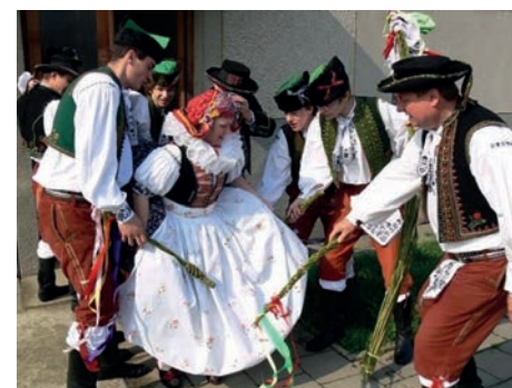
↑ Scène traditionnelle en République tchèque.

chrétienne apporte à coup sûr quelques jours de plaisir en famille, de l'amusement pour les enfants et une pause dans le quotidien dans les deux pays.