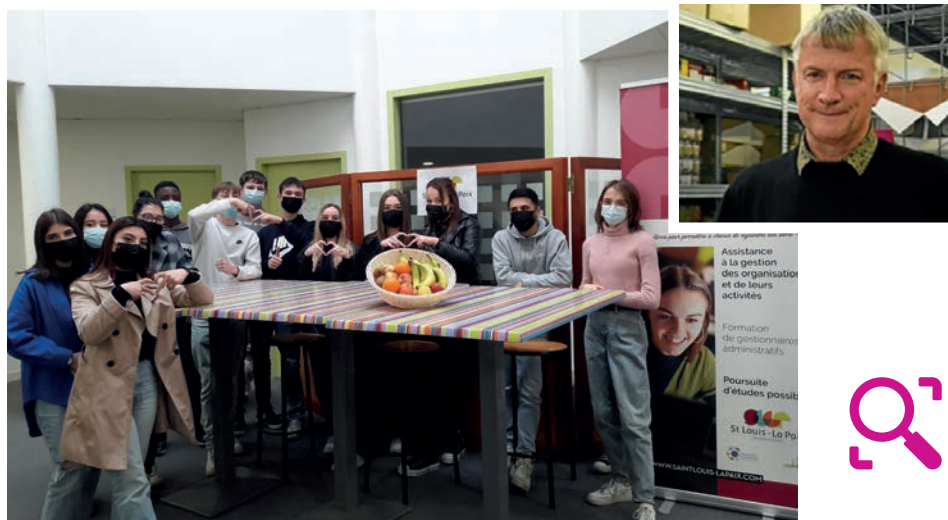
↑ Au sens propre comme au sens figuré, l'implication des 1 re Agora donne déjà des fruits.

Depuis la mi-février, le lycée Notre-Dame de la Paix organise une collecte de fruits et légumes frais au profit des Restos du Cœur de Lorient. C'est pour répondre à une problématique du cours de Pratiques professionnelles, que les élèves de 1 re Agora ont imaginé installer un point de collecte de fruits et légumes frais à l'antenne des Restos du Cœur de Lorient. Les surplus et invendus des professionnels du maraîchage sont concernés par cette collecte, ouverte également aux particuliers disposant de potagers. Les élèves, leur professeur ainsi que M. Le Borgne (responsable de Lorient) espèrent un sursaut de générosité pour les aider à faire face à une situation de plus en plus difficile.