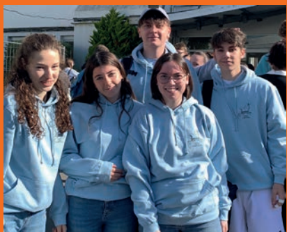
↑ Les sweats 2022 sont arrivés pour l'été !