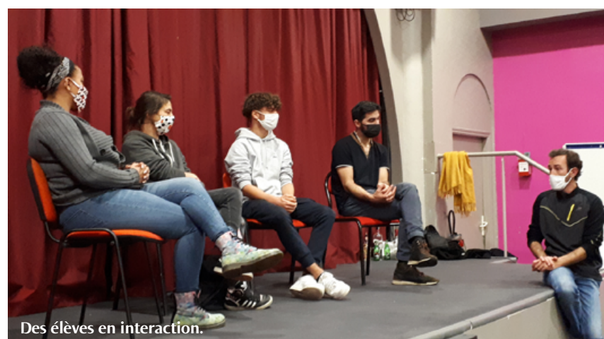
Des élèves en interaction.

https://saintlouis-lapaix.com/lycee-saint-louis