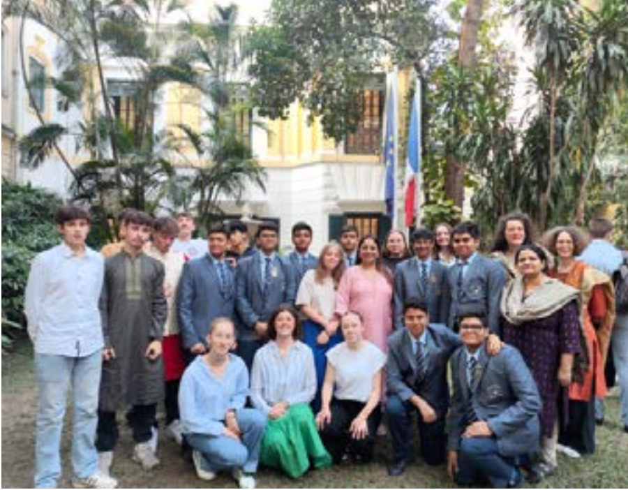
↑ Immersion culturelle pour les élèves et accompagnateurs à Calcutta.

F in novembre, nous étions douze élèves, ainsi que deux professeurs, à avoir la chance de participer à un échange linguistique direction Kolkata, en Inde. Après un long voyage, nous avons été merveilleusement bien accueillis par nos familles respectives, qui nous ont dorlotés durant tout le séjour. Ce fut une expérience enrichissante et mémorable, grâce à de nombreuses découvertes culturelles, culinaires et de paysages variés à apprécier. Nos matinées consistaient à participer à la vie du lycée de nos correspondants puis