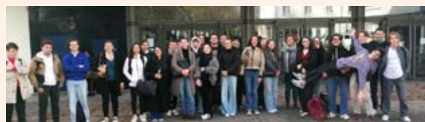
↓ Les germanistes devant le Cinéville pour l'exposition cinéma.