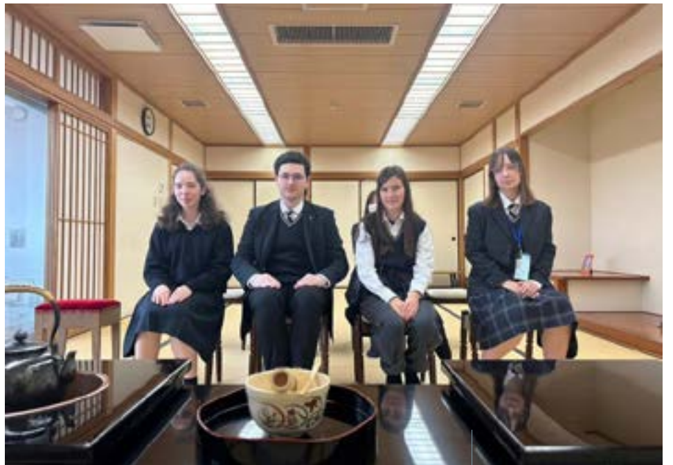
↑ Nos élèves au cœur de la culture nipponne.