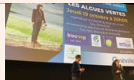
↑ Un ciné-débat passionnant sur les algues vertes.

Pour soulever ce problème, la journaliste