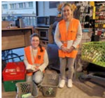
« Deux des élèves ayant participé à la collecte. »

Le 24, 25 et 26 novembre derniers, de nombreux lycéens se sont proposés pour participer à la collecte des Banques alimentaires françaises. Postés pour la plupart au Carrefour city à côté du lycée, ils ont pu, à tour de rôle, collecter des denrées alimentaires ou d'hygiène pour les différentes associations françaises. "Cette journée m'a permis de me rendre compte de la chance que nous avons de vivre dans de bonnes conditions