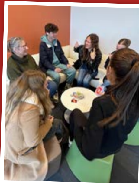
↑ Les internes profitent d'une cafétéria toute neuve depuis la rentrée 2024.