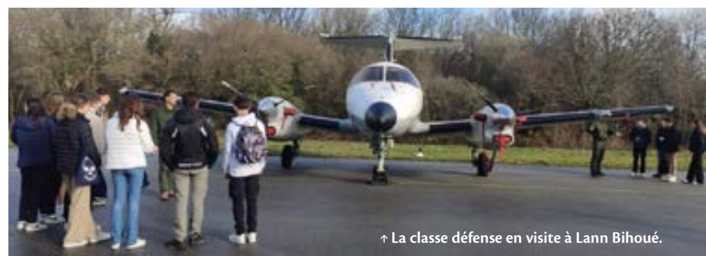
↑ La classe défense en visite à Lann Bihoué.

La classe défense est engagée avec la Marine nationale pour mieux connaître les enjeux stratégiques des armées, l'usage démocratique de la force et les métiers militaires et leurs valeurs. Sorties et interventions sont souvent au programme.