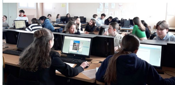
↑ Des secondes 4 rédigent leur short story.