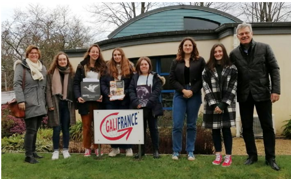
↑ Les germanistes lors de leur visite chez Galifrance.