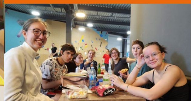
↑ Un goûter pour reprendre des forces.