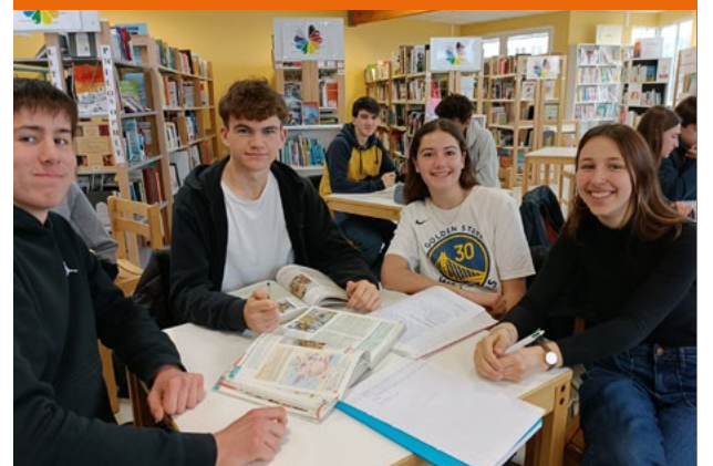
↑ Des révisions dans la bonne humeur au CDI

Le CDI vous accueillera pendant cette période ! Éloignez aussi toutes les distractions qui pourraient vous déconcentrer. Cependant, accordez-vous des pauses, privilégiez la qualité à la quantité. Il est également important de diversifier les sources de révision pour assimiler des connaissances originales. Celles-ci viendront personnaliser et valoriser votre copie le jour de l’examen.