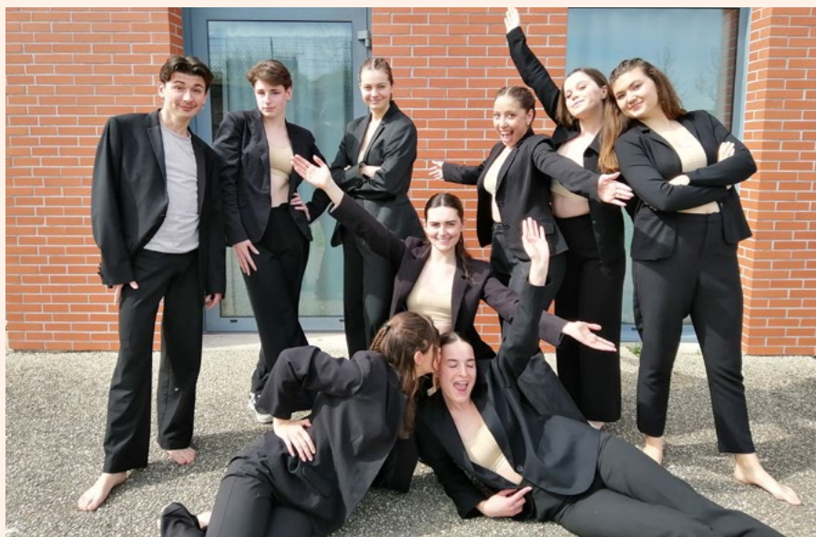
↑ Nos finalistes pour les nationaux de danse.