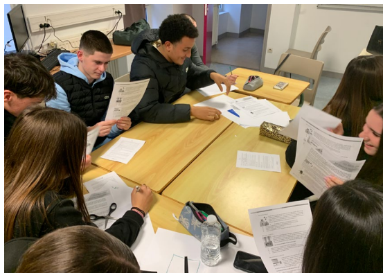
↑ Des élèves investis dans leur projet d'entreprise.

"Cela nous permet de travailler en équipe et de développer l'autonomie. On imagine le projet et on le concrétise toute l'année sous plusieurs aspects, notamment la conception,