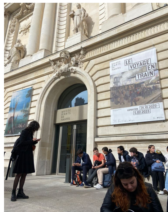
↑ Les élèves de spé HLP devant le Musée des Arts de Nantes.

L a spécialité Humanités, littérature et philosophie enrichit notre imagination, notre créativité et notre culture générale. Les humanités permettent de dépasser son propre soi, d'appréhender son savoir-faire argumentatif mais aussi d'apprendre à raisonner et organiser notre pensée de façon convaincante et logique. La philosophie est avant tout un domaine ouvert à tous, c'est pourquoi cette spécialité débute en première. Elle aide à mieux aborder l'épreuve de philosophie en terminale.