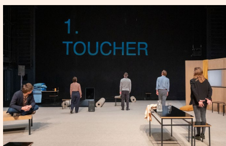
↑ Quand les désirs refoulés surviennent...