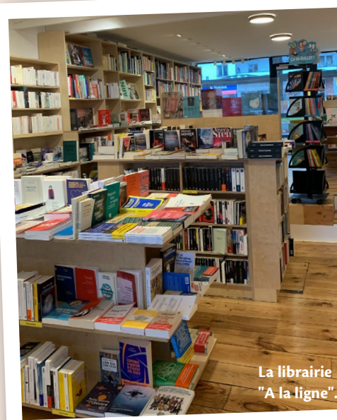
La librairie "À la ligne".

J'ai beaucoup aimé le contact avec les clients, tous plus passionnants et passionnés les uns que les autres. Cette expérience me permet de vous encourager à acheter