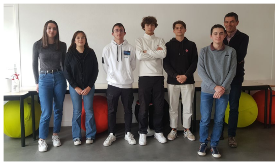
↑ Des élèves motivés avec leur enseignant.

Le programme est intéressant, cela me permet de compléter ma formation au lycée et de voir mes compétences en science politique pour ainsi essayer de réussir le concours d'entrée.