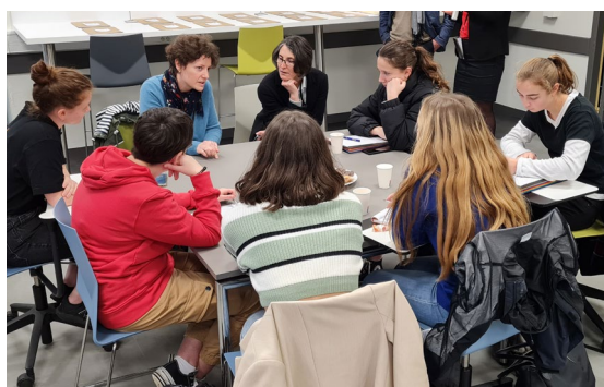
↑ Les lycéennes rencontrent des femmes ingénieures.

Le jeudi 12 janvier a eu lieu la journée "femmes ingénieures", ayant pour objectif de permettre aux jeunes filles de se projeter dans des professions où la présence féminine est faible. Cette journée s'inscrit dans le cadre des actions de la cordée de la réussite "Hissez Haut!". Elle a permis à des filles de troisième, seconde, première et terminale, du bassin de Lorient, d'aller découvrir les parcours et débouchés que pouvait proposer une école d'ingénieur. Ainsi, elles se sont rendues à l'Icam de Vannes (école d'ingénieur généraliste) pour échanger avec des professionnelles de différents secteurs et métiers, qui leur ont présenté leur parcours, tous très divers. Cela a permis de montrer les grandes possibilités de professions qu'offrait ce genre d'école. Puis, des étudiantes de 1 re et 2 e année leur ont fait la visite du campus où elles ont pu s'informer sur les cours