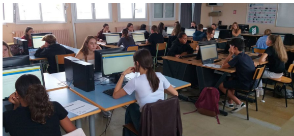
↑ Des élèves studieux pour le bac américain.

L e bac américain est un double bac anglais en extrascolaire, sur 2, 3 ou 4 ans en fonction de votre niveau initial. Les professeurs américains mettent à disposition des cours sur une plateforme en ligne, vous rendez plusieurs travaux par semaine. Cela fonctionne en semestre et vous assistez à plusieurs visioconférences. Tout se fait par ordinateur.