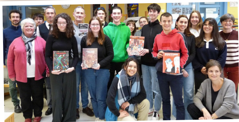
↑ Des élèves et leurs encadrants lors du vote pour le concours.