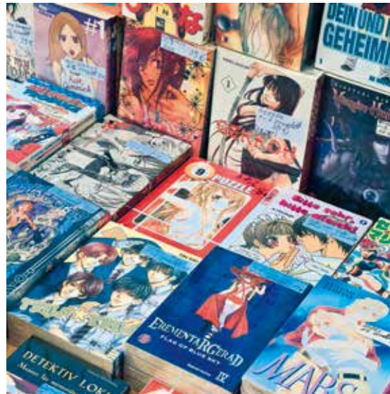
Un nouveau volume d'un manga est publié environ tous les trois mois.