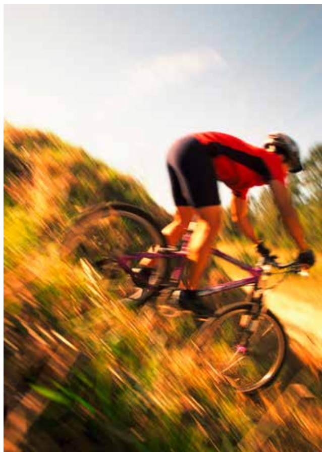
Le cyclo-cross a été une spécialité française pendant de nombreuses années.