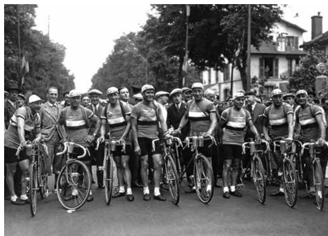
L'équipe de France au départ du Tour de France en 1932.