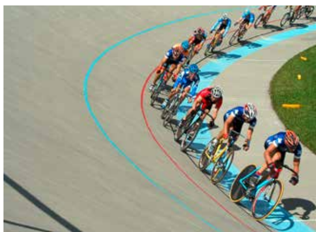
Sur piste, les cyclistes utilisent des vélos à pignons fixes.