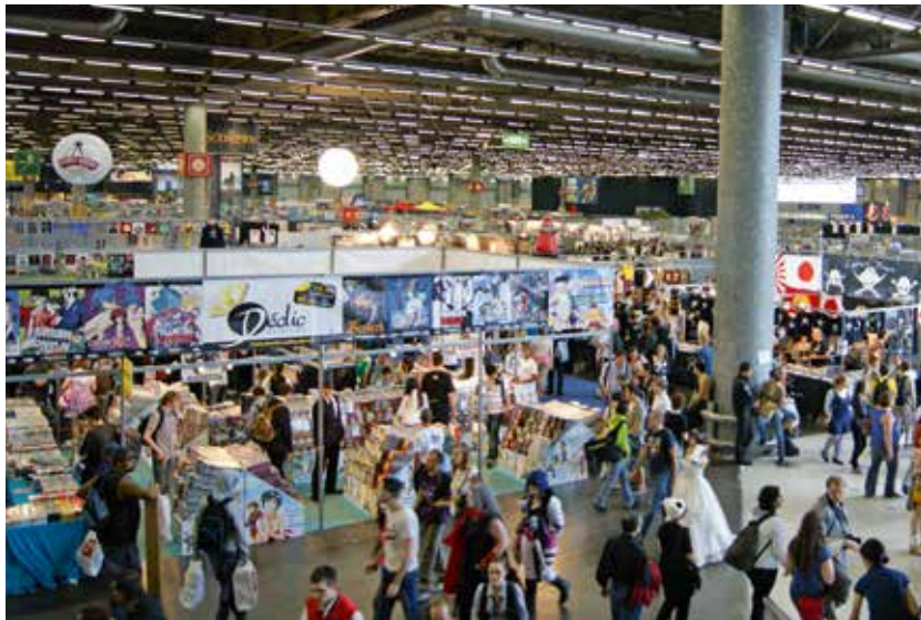
La Japan Expo se tient tous les ans au mois de juillet au parc des expositions de Villepinte.