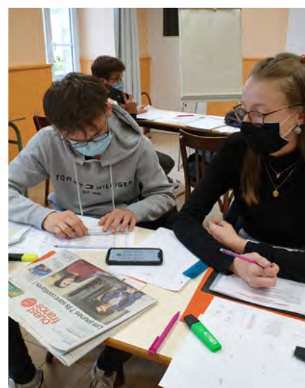
➤ L'opération Phoning avec Ouest-France.