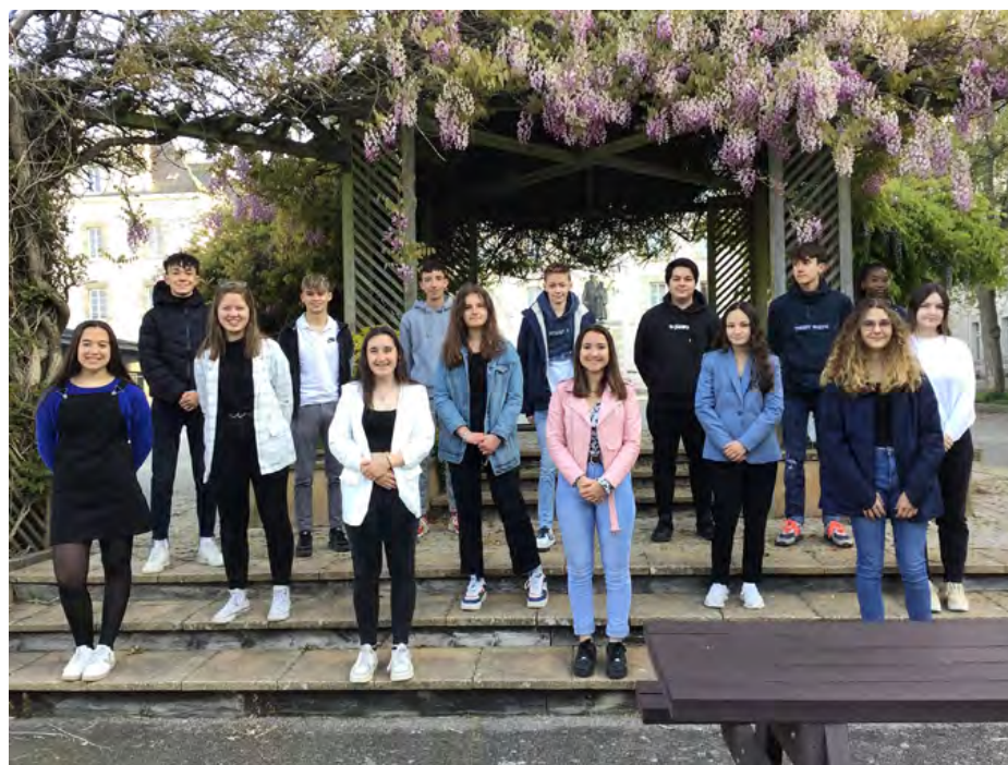
➤ Le groupe de Management et gestion.