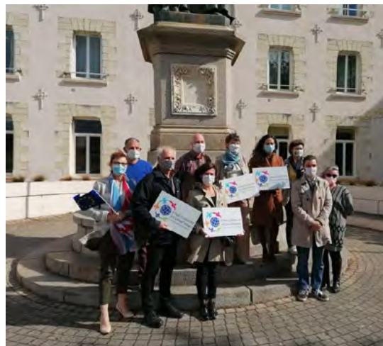
Remise des plaques par la DDEC le 17 mai à l'occasion du lancement de la semaine internationale.