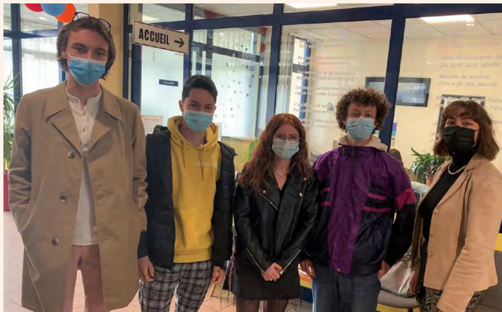
➤ Quelques élèves investis dans le compte Instagram.