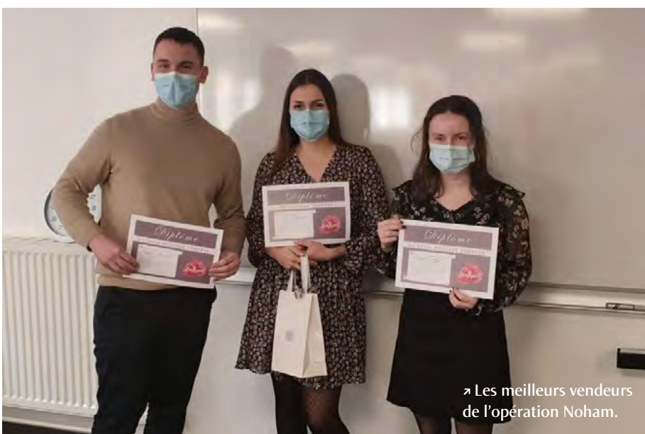
➤ Les meilleurs vendeurs de l'opération Noham.