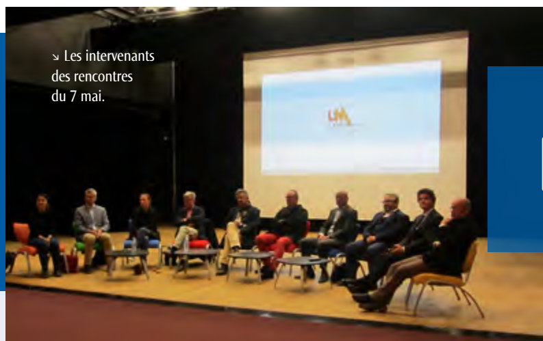
↳ Les intervenants des rencontres du 7 mai.