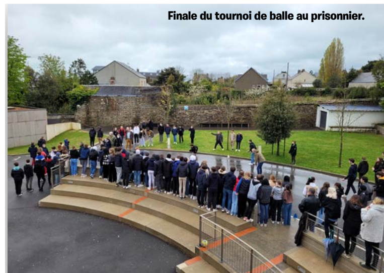
Finale du tournoi de balle au prisonnier.

Le jour de la solidarité était fantastique! On a fait plein de jeux et d'activités. On a même chanté pendant une heure mais il n'y avait pas les sœurs. Comme c'était juste avant les