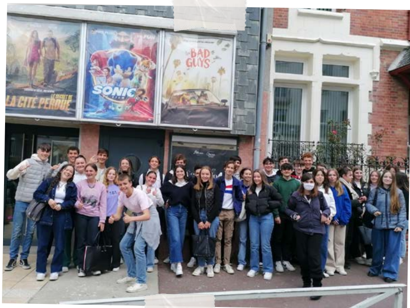
Les lycéens italianistes au cinéma Le Select.

Ce film italien était sous-titré, mais j'ai plutôt essayé de comprendre la langue italienne.