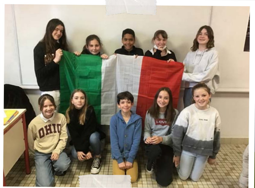
Les italianistes de 6 e .

Pour finir, nous avons chanté tous ensemble. C'était un beau moment de partage.