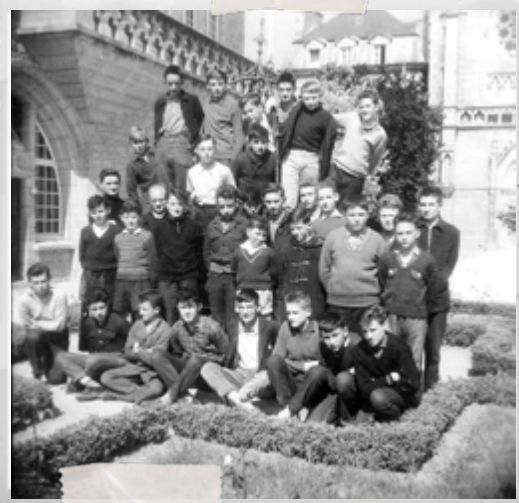
La 4 e rose de 1958-1959.