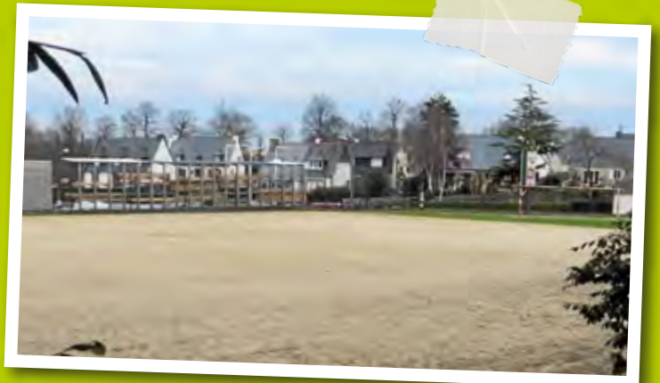
La nouvelle piscine sera construite à cet emplacement.