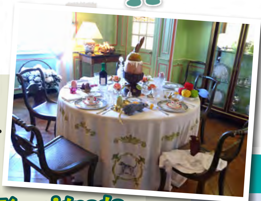
Pâques dans la salle à manger du château de Cheverny.