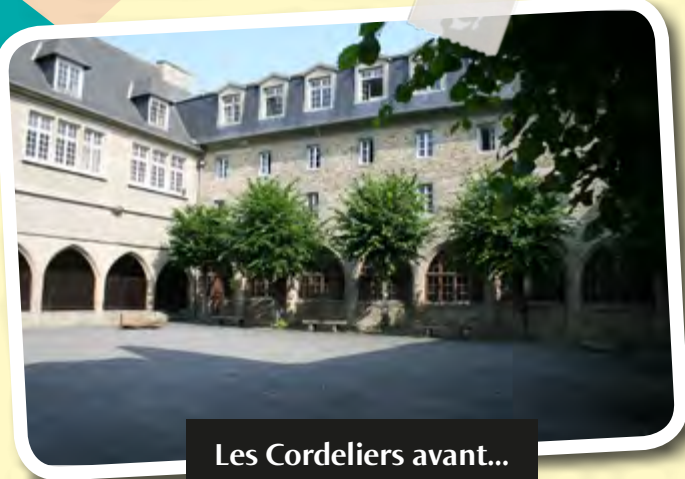
Les Cordeliers avant...