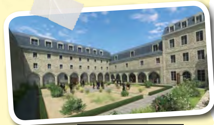
... et demain !