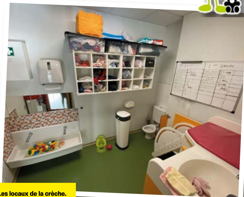
Les locaux de la crèche.