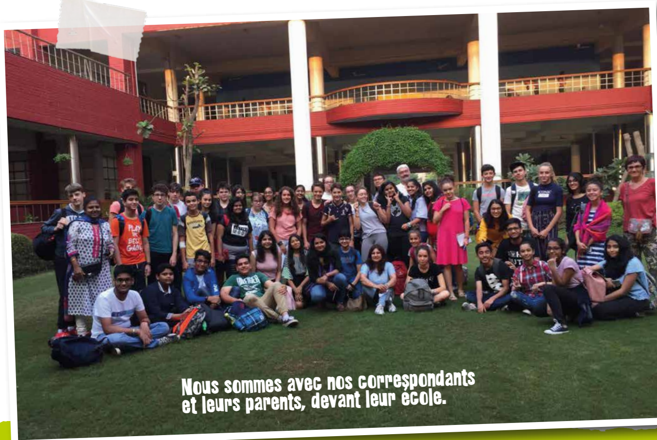
Nous sommes avec nos correspondants et leurs parents, devant leur école.