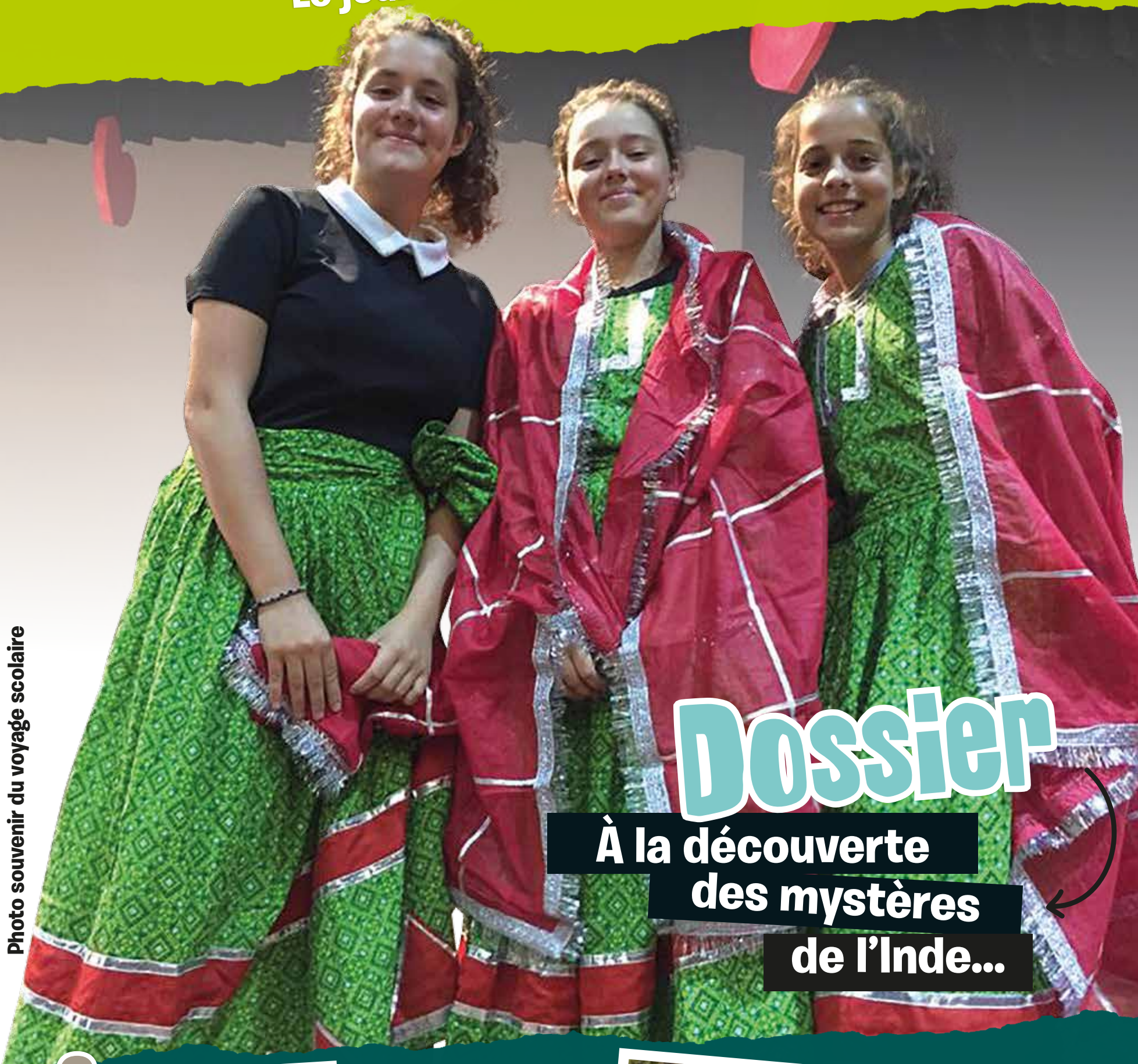
Photo souvenir du voyage scolaire

Le journal du collège Notre-Dame de Billom