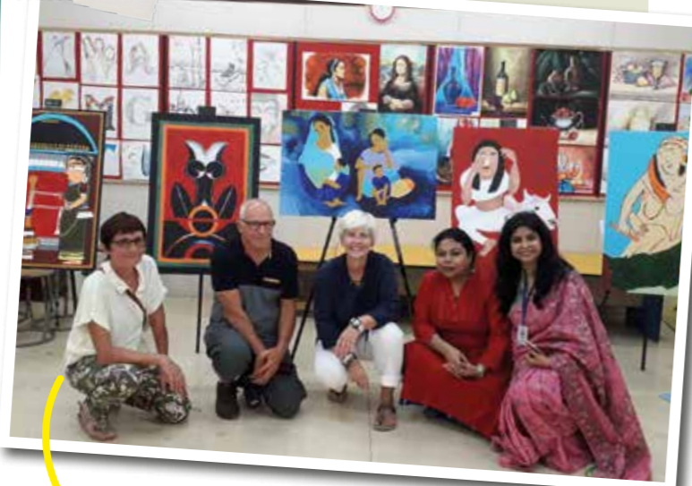
Les professeurs d'art en Inde avec nos accompagnateurs.

Ce qui m'a marquée : la pollution qui rend l'air difficile à respirer pour nous, Français. »