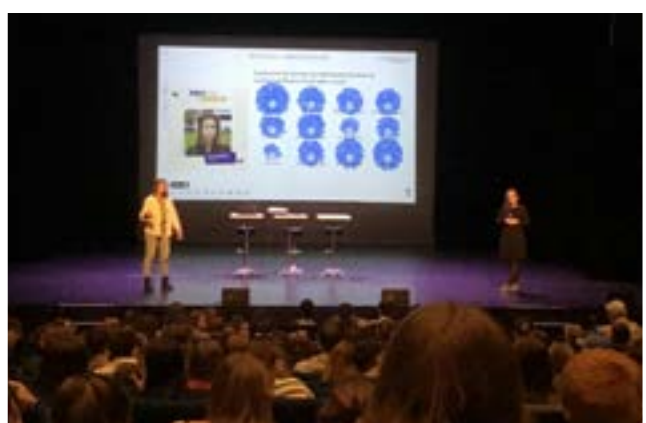
Présentation des trois lauréats en lice pour le Prix Liberté.

l'établissement, se sont retrouvés au théâtre de Coutances le 5 avril. Ils ont été invités à voter pour l'un des trois lauréats sélectionnés en janvier