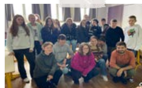
Les élèves du Club Europe et les jeunes volontaires européens.