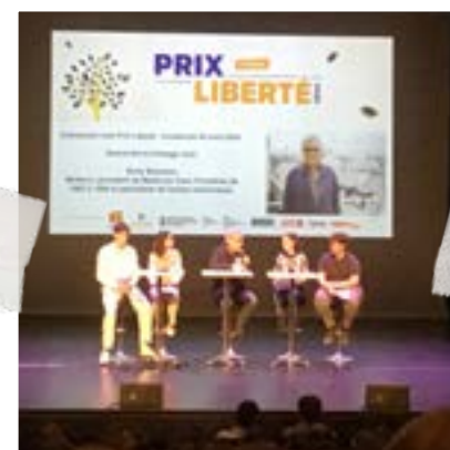
Rony Braumann échangeant avec les lycéens.