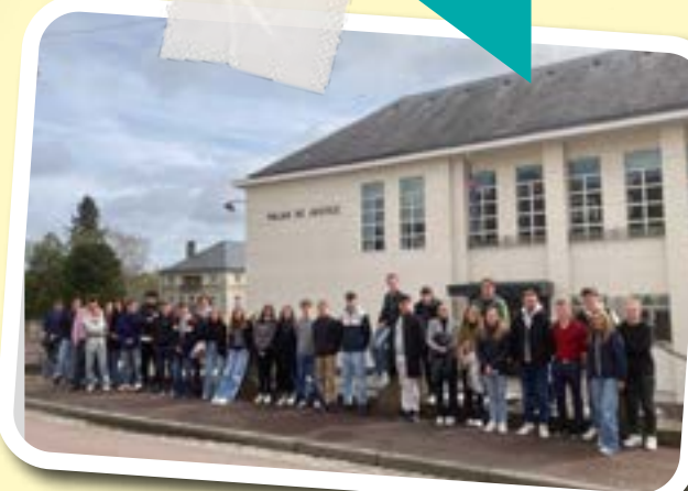
Visite au tribunal : mardi 2 avril 2024, les terminales DG et les premières et terminales STMG assistent à une audience du tribunal correctionnel de Coutances.