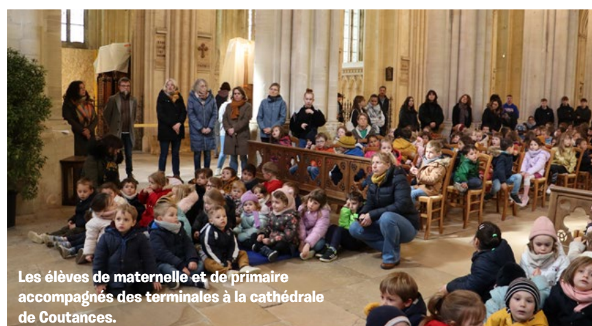
Les élèves de maternelle et de primaire accompagnés des terminales à la cathédrale de Coutances.