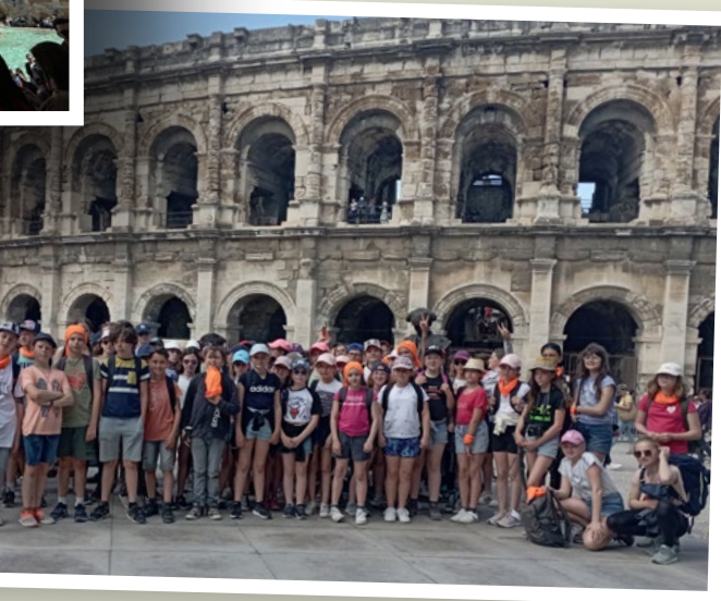
Les 6 es devant les Arènes de NÎMES.