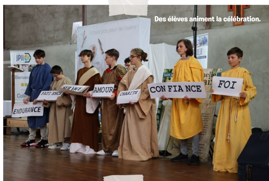
Des élèves animent la célébration.

Pour les élèves comme pour les intervenants, le flash mob reste le moment le plus apprécié de tous. "J'étais émue au moment du flash mob" nous confie Nadine.