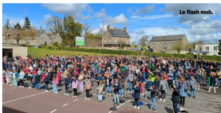
Le flash mob.