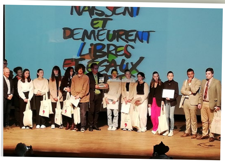
Remise des prix pour les lauréats.

En mars dernier, sept élèves de 1 re du lycée Jean-Paul II ont participé au concours de plaidoiries proposé par la Ligue des Droits de l'Homme.