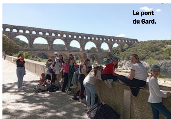
Le pont du Gard.

D u 2 au 9 mai, 98 élèves de 6 e ont délaissé leur salle de classe pour le soleil de Provence. Douze heures de trajet en bus pour s'immerger dans l'histoire et la littérature locale. Les élèves ont commencé leur périple par le théâtre d'Orange et le pont du Gard. Ensuite dans un cadre plus bucolique, ils ont suivi les traces de Marcel Pagnol. Le samedi, ils ont remonté le temps au Glanum. Le jour suivant, les pieds dans l'eau, ils ont récolté le sel à Sainte-Marie de la mer. Enfin sous une chaleur éprouvante, ils se sont divertis aux arènes de Nîmes. Pour se préparer, ils ont travaillé en amont. Tout d'abord en français, ils ont pu découvrir le personnage de Marcel Pagnol. "On a regardé les films de Marcel Pagnol" nous confie Violette, 11 ans. Et lors de leur cours d'histoire, ils ont poursuivi leur chapitre sur l'antiquité. Les 6 es ont parcouru les collines sur les pas du célèbre auteur Marcel Pagnol. Malheureusement la météo a rendu cette randonnée pénible. Léonie confirme: "Il faisait beaucoup trop chaud!" Jules a acheté quelques souvenirs à ses proches: "J'ai acheté un dessous de plat La Baleine pour ma maman".