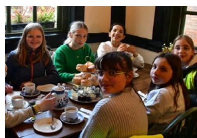
Tea time à WINDSOR pour les 5 es .