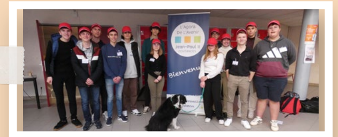
Les élèves de 1 re STMG organisateurs de l'événement.