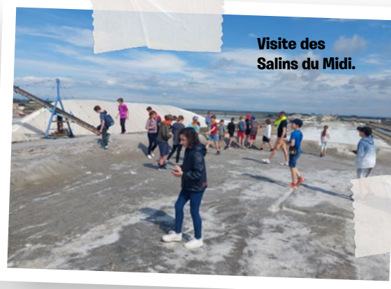
Visite des Salins du Midi.