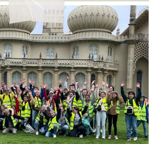
Les 5 es devant le Royal Pavillon à BRIGHTON.