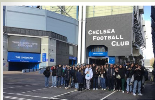
Les secondes avant la visite du club de football de CHELSEA.