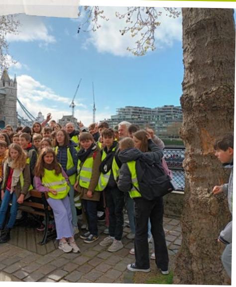
Découverte pédestre de LONDRES.