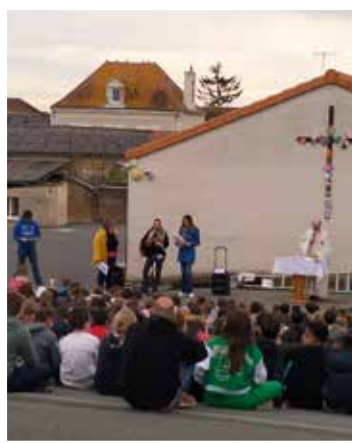
Une célébration vécue en avril.

Oui, je vais aux messes importantes comme Pâques et Noël.