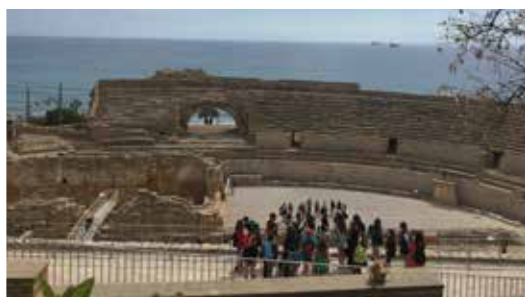
L'amphithéâtre de Tarragone.