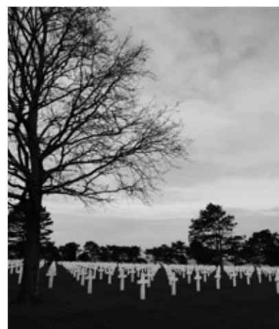
Le cimetière américain de Colleville.