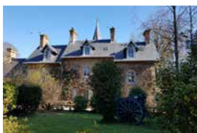
English Manor, château de la Baudonnière.