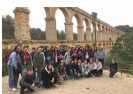
L'aqueduc de Tarragone.