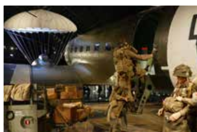
Le Musée Airborne à Ste-Mère-Église.