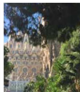
La Sagrada Familia.